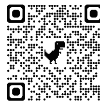
研究室の最新情報はこちら オリジナルウェブサイト