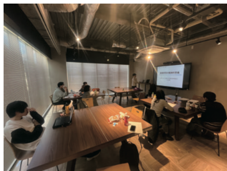
写真 Hyggeでのゼミの様子 (2026年度卒研生も交えて)